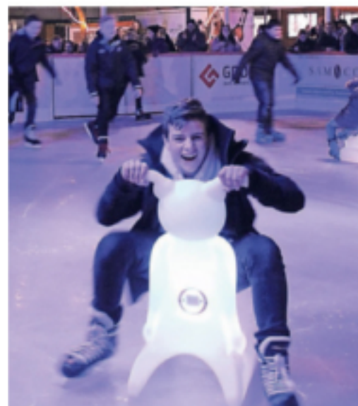
In der Wegberger Innenstadt setzt der Adventsmarkt festliche Akzente. Vor dem Rathaus sorgt die „Wegberger Eisbahn“ bis in den Januar hinein für winterliches Vergnügen.