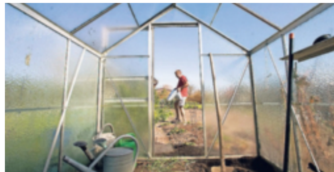
Pflanzen brauchen gute Erde zum Wachsen. In vielen Substraten ist aber Torf enthalten - dessen Abbau schadet der Umwelt.

In den Gartencentern, bei Fachhändlern und in Bau-