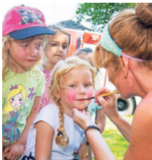
Der markante Natursteinbrunnen weist morgen den Weg: „Erkelenz trifft sich“ ab 16 Uhr auf dem Mühlenplatz im Neubaugebiet Oerather Mühlenfeld. Auch auf die kleinen Gäste wartet ein großes Programm.