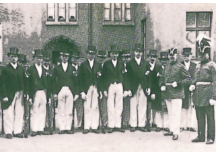
Ein Bild aus der Gründerzeit, als die heutigen Alten Freunde sich als 4. Grenadier Kompanie zusammenschlossen.

DER ST. SEBASTIANUS SCHÜTZENVEREIN HEERDT FEIERT VOM 17. BIS 20. AUGUST