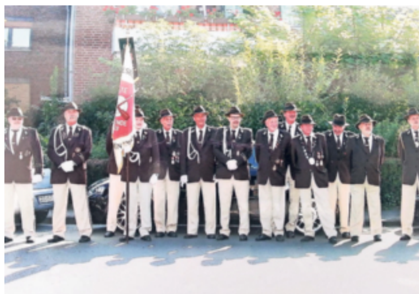
Heute blicken die Alten Freunde auf eine lange Tradition zurück ohne dabei nötige Zukunftsvisionen aus den Augen zu verlieren.