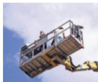
Die Arbeitsbühne wird zur Aussichtsplattform.