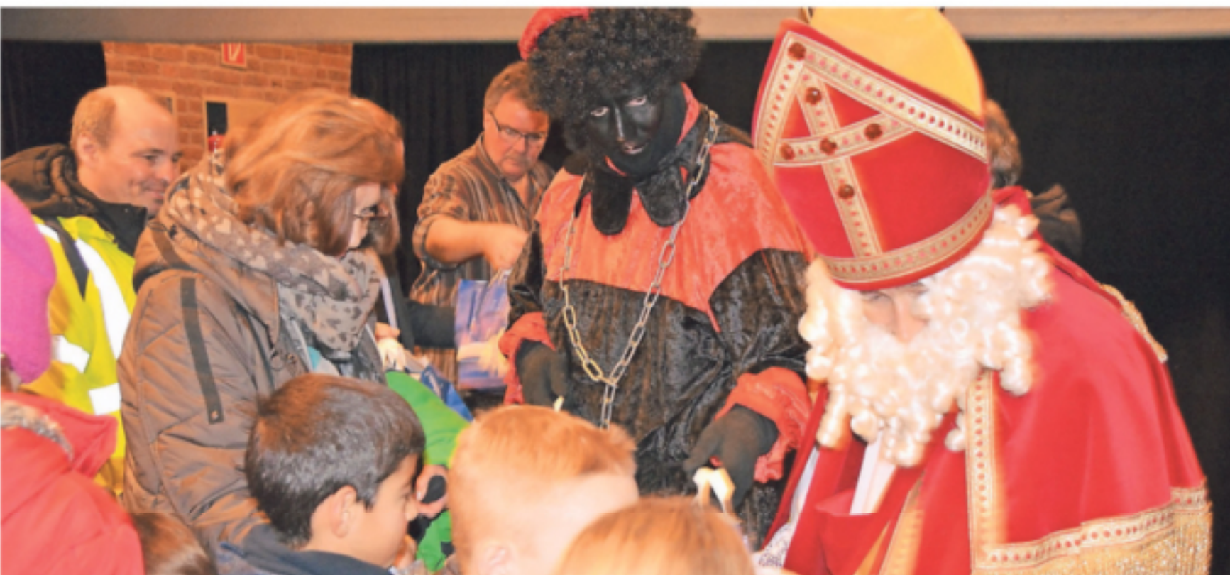
Der Nikolaus und sein Knecht Ruprecht kommen am Sonntag gegen 17.30 Uhr mit Kutsche zum Bürgerhaus. Im großen Saal verteilen sie Geschenke an die Kinder.

Der Nikolausmarkt am 8. und 9. Dezember ist in Kranenburg einer der Höhepunkte im Jahr.